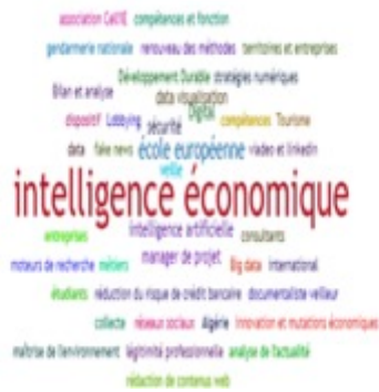
Figure 3. Visualisation des Tags en Intelligence Economique (powered by Sindup®)

Ce qui ressort aussi, c'est que l'IE est un dispositif national ou construit par un groupe privé, qui peut être instruit et renseigné sur le lobbying et la sécurité dans un contexte international.