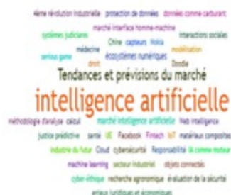
Figure 5. Visualisation des Tags en Intelligence Artificielle (powered by Sindup®)

La figure 5 montre les résultats de veille sur l'IA qui est considérée comme le cœur de la 4 e révolution industrielle (de fait la poursuite de la 3 e ). Elle provoque la constitution d'un large écosystème numérique intégrant des outils et des compétences permettant de détecter les tendances et prédire les marchés. C'est donc une révolution industrielle dont la finalité est similaire, sur le plan marketing, à l'utilisation classique des outils de veille stratégique. Outre l'aspect défensif de cette présentation marketing, elle dénote à nouveau une récursivité (cf partie 3) qui signifie qu'on arrive ici aussi à des concepts fondamentaux. 2 L'IE peut désormais utiliser ses propres outils pour se questionner.