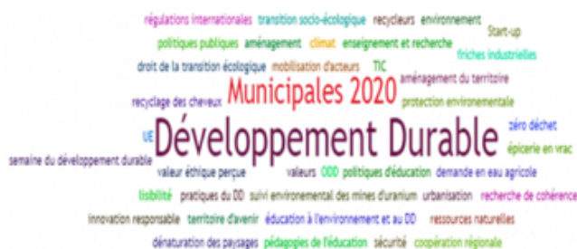
Figure 1. Visualisation des Tags en Développement durable (powered by Sindup®)

Une autre revue bibliométrique récente a analysé les publications sur les Objectifs du Développement Durable en utilisant des termes de recherche dans les titres, résumés et mots clés et en veillant dans Web of Sciences.