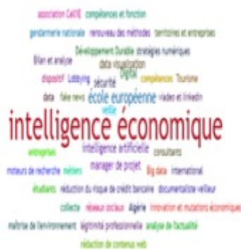
Figure 3. Visualisation des Tags en Intelligence Economique (powered by Sindup®)

Nous observons une évolution rapide de l'IE qui s'appuie sur les plateformes de veille stratégique au sein des pôles de compétitivité, des chambres d'agriculture, des coopératives, des différentes entreprises industrielles et même des sociétés de services. Les partenaires publics et privés abonnés ou adhérents de ces plateformes jouent le rôle de contributeurs et diffuseurs des informations touchant à leurs rôles et à leurs activités, institutionnelles ou économiques. La figure 3 montre que sur la base de la veille d'actualités, il existe des liens entre l'IE, le DD (sur les plans environnemental, économique et social) et l'IA (sur le plan technologique : moteurs de recherche, digital, Big Data et data visualisation , stratégies numériques, ...).