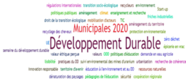
Figure 1. Visualisation des Tags en Développement durable (powered by Sindup®)

Une autre revue bibliométrique récente a analysé les publications sur les Objectifs du Développement Durable en utilisant des termes de recherche dans les titres, résumés et mots clés et en veillant dans Web of Sciences.