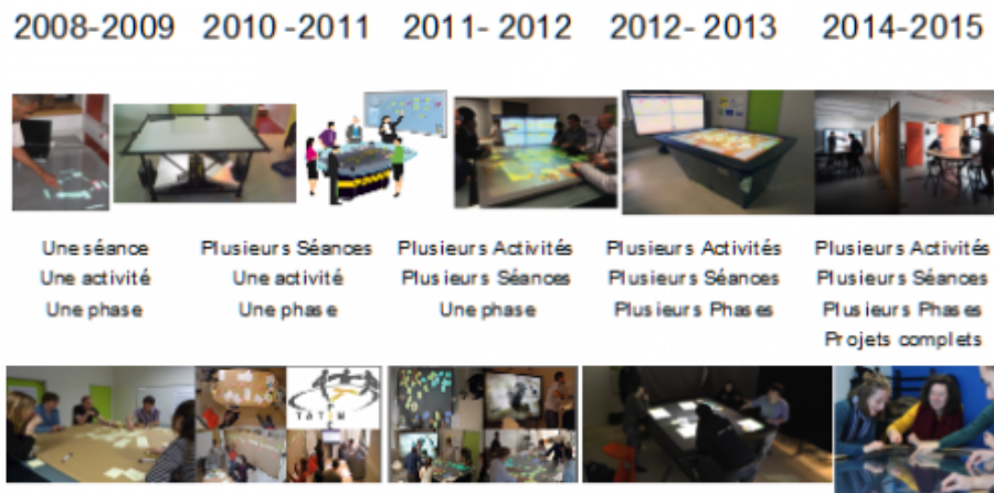
Figure 4 : Les différentes expérimentations.

2013, 2014 ; Guerra, Gidel, et Vezzetti 2015).