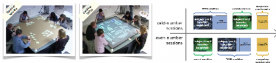
Figure 2 : Études comparatives « papier » vs. numérique

Ces expérimentations ont donné lieu à des analyses ethnographiques complétées par des analyses des vidéos des séances (figure 3). Ces vidéos ont été codées à l'aide du logiciel ANVIL afin de pouvoir comparer les temps de paroles, la production des idées, les prises de décision, les échanges (questions, réponses, envoi d'information écrite ...), les croisements perceptifs (regards, déictiques...).