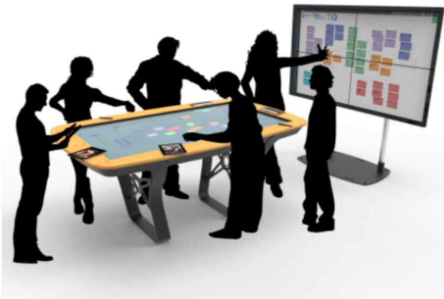
Figure 1 : Dispositif constitué d'une table interactive et d'un tableau interactif.

Notre hypothèse de travail est qu'en proposant des surfaces de travail partagées (figure 1), nous pourrions combiner les avantages de l'externalisation de la pensée par l'écriture ou le dessin tout en conservant la communication orale en face à face et les croisements perceptifs associés.